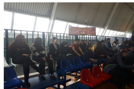
Больельщики на КЭС-Баскет