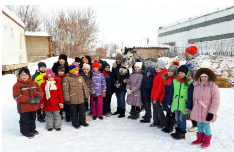
Посещение конюшни слабовидящими детьми