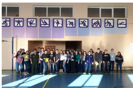
Конкурс в рамках Клуба выходного дня «Нам есть чем гордиться»