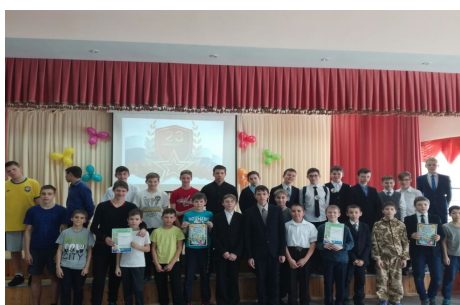
Конкурс к 23 февраля «Армейский калейдоскоп»