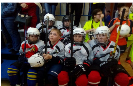
Закрытие Спартакиады СПО

Шесть дней Ежеквартальная газета МБОУ «ЗСОШ №6»