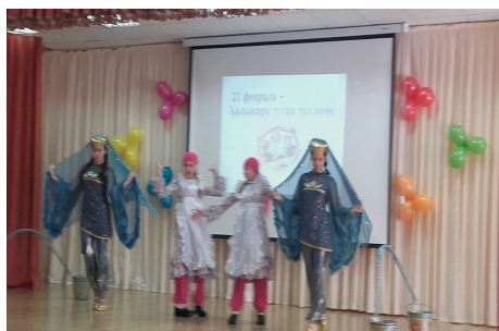
День Родного языка