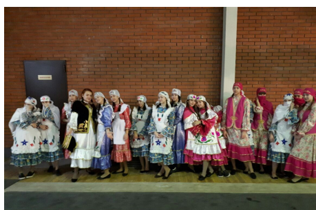
Церемония открытия турнира кушей памяти М. Джалиля