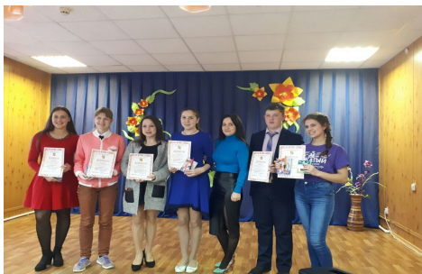
Конкурс «Замечательный вожатый»