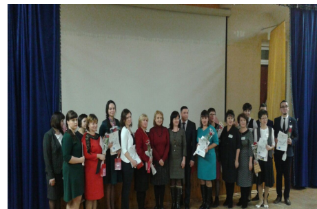
Зональный тур конкурса «Учитель года-2017» в Муслимово